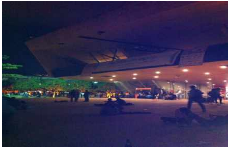
Figura 3. Fotografía donde se evidencia tanto la plataforma desde donde se observan las proyecciones de cine, como las instalaciones del parque.

Así mismo los empleos de este espacio público por parte de la población en cuestión, están determinados por los elementos ambientales que produce el parque tales como la plataforma al aire libre, especialmente cuando se proyectan películas; no obstante los espacios frecuentemente utilizados por las juventudes LGBT que asisten a este espacio son las zonas arborizadas que funcionan como separadores o delimitan al parque y la parte posterior del mismo.