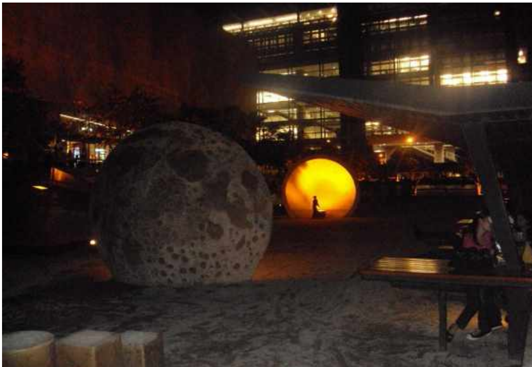
Figura 2. http://tusuenoshechosparuqe.blogspot.com

En segundo lugar el sistema de flujos o acciones, es decir las prácticas y comportamientos de los usuarios; se pueden comprender para el Parque de los Deseos desde dos perspectivas. La primera es el objetivo por el cual se construyó tal espacio público, donde “las personas asocian servicios públicos con un proceso científico y técnico, pero lo que realmente se necesita es aprender a reconocer al agua, la energía y las telecomunicaciones en cualquier lugar, como elementos básicos de la cotidianidad. (Tomado de Fundación EPM) y a segunda perspectiva son las acciones o usos que los usuarios que visitan el lugar realizan. Figura 2. Esfera celeste, atracción de interacción entre la ciencia y la tecnología con la ciudadanía.