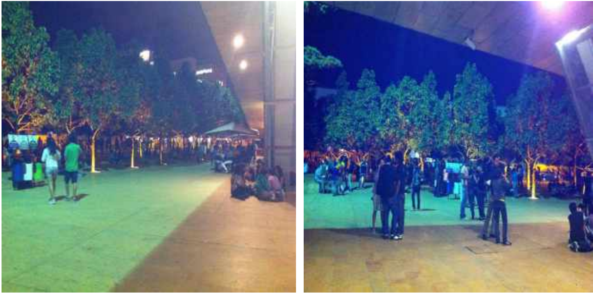
Figuras 4 y 5. Zonas arborizadas frecuentemente utilizadas por estas juventudes

Ahora bien, un factor que determina las temporalidades de las sociabilidades recurrentes por parte del sector LGBT los fines de semana en este espacio, especialmente los viernes, es la estación Universidad del Metro de Medellín. Al poseer una conexión directa con el parque, proporciona una accesibilidad y conectividad no sólo de personas del municipio de la ciudad, sino también de diferentes municipios como Bello, San Antonio de Prado, Itagüí, entre otros, al ser un equipamiento que atraviesa toda la ciudad y poseer sistema integrado de buses. Es por esto que las horas más utilizadas por la población analizada para llegar al parque son entre las 5:00 p.m. y las 7:00 p.m. y el momento para retirarse del lugar está entre las 10:00 p.m. y las 11:00 p.m. momentos entre los cuales que el sistema de transporte masivo Metro cierra su funcionamiento habitual. Los anteriores datos son adquiridos cuando se preguntó acerca de las horas de llegada y retirada del parque.