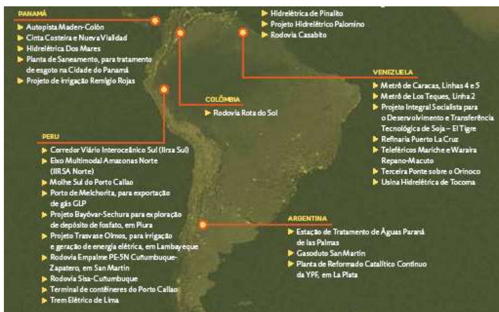
Mapa 1: ODEBRECHT – Principais obras na América do Sul 2010