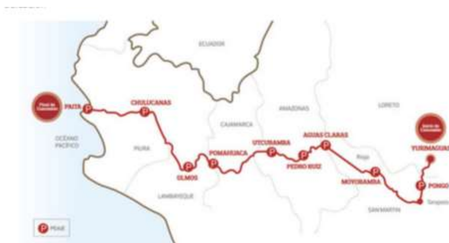
Mapa 2: IIRSA NORTE

A Concessionária IIRSA Norte é a empresa que mantém e opera a concessão dos 955 Km da estrada que une o porto marítimo de Paita com a cidade de Yurimaguas, atravessando as regiões de Piura, Lambayeque, Cajamarca, Amazonas, San Martín e Loreto; tornando possível a interconexão fluvial do norte peruano com o Brasil (IIRSA NORTE, 2015). Essa concessionária está formada não apenas pela construtora Odebrecht, senão também pela Andrade Gutiérrez e Graña y Montero. A seguir podemos observar a localização dessa obra de infraestrutura: