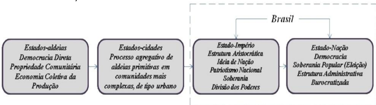
Esquema 1 – Fases de evolução do Estado na concepção de Oliveira Vianna.

A colonização portuguesa fundamentada na distribuição de terras em sesmarias individualistas (ao contrário da colonização espanhola, a qual pressupunha propriedade comunitária da terra e uma economia coletiva da produção baseado, principalmente, na agricultura e no pastoreio) não permitiu que se forjasse no Brasil um espírito público e uma aptidão à vida democrática , visto nas aldeias primitivas ( pueblo ), à maneira ibérica (VIANNA, 1999). Ao se pautar na interpretação de Vianna, verificamos que as raízes culturais de nossa vida pública excluem radicalmente uma vida política pautada em princípios democráticos (não tivemos registrado em nossa história ou memória, por exemplo, uma experiência de participação tal qual a dos Estados-aldeias Europeus). Para o autor, a Europa passou por uma formação e desenvolvimento dos Estados, com quatro fases distintas e, ao mesmo tempo, semelhantes entre si. No Brasil, no entanto, desconhecemos as primeiras fases (Estados-aldeias e Estados-cidades), as quais seriam responsáveis por incutir no povo um ideal democrático. Abaixo, dispomos um quadro explicativo com as evoluções do Estado.