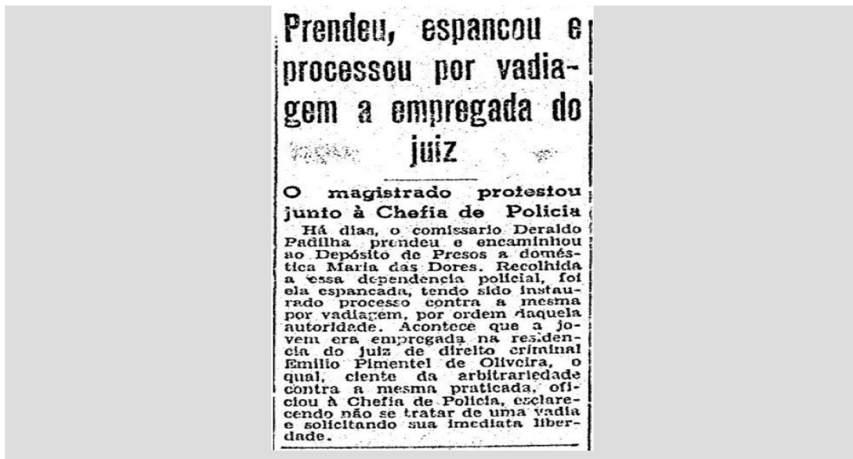
Figura 1 – Criminalização da juventude pobre e negra por vadiagem no Brasil – Ano de 1952