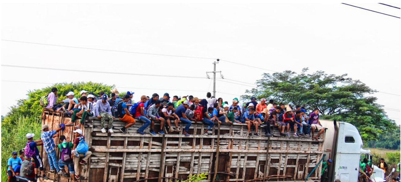
La caravana de migrantes centroamericanos pasa por Chiapas, México.