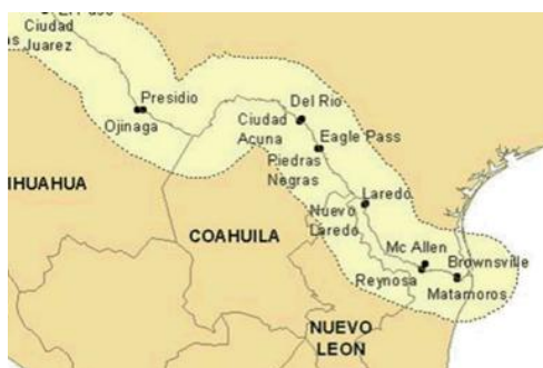
Imagen 1. Ciudades fronterizas de Coahuila

EL estado de Coahuila se encuentra ubicado al norte de la república Mexicana, compartiendo con los Estado Unidos de Norteamérica una frontera de 512 kms, teniendo 7 municipios fronterizos, como puede verse en la imagen 1, por lo cual se convierte en paso para migrantes tanto nacionales, como centroamericanos. Sin embargo para el gobierno estatal, tan fenómeno parece no existir, ya que no hay ningún programa estatal enfocado a la migración, así mismo al revisar la cuenta pública de los últimos doce años, se encontró que no ha existido ni existe ninguna partida asignada a este concepto.