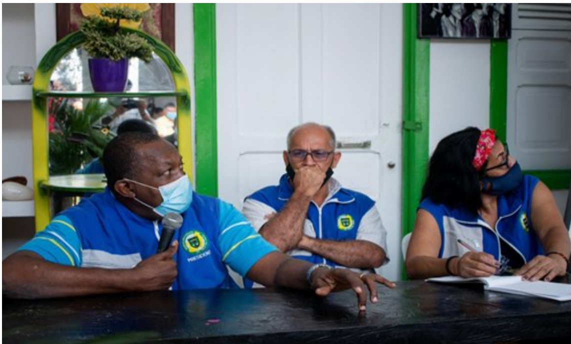
Anexo 3. Encuentro de participación de Política Pública de Acción Comunal y Política Pública de Juventudes, en Cali Distrito Especial. Día 13 de octubre 2021